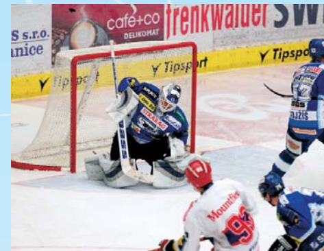
Samotný zápas příliš zábavy nepřinesl. Jihočeši se toporně dostávali přes brněnskou obranu a nakonec nedokázali dát za pětadesát minut ani jednu branku.