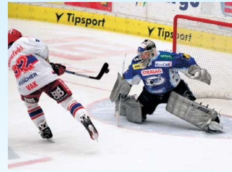
A jelikož domácí neproměnili ani jeden ze tří nájezdů, získalo Brno dva body.