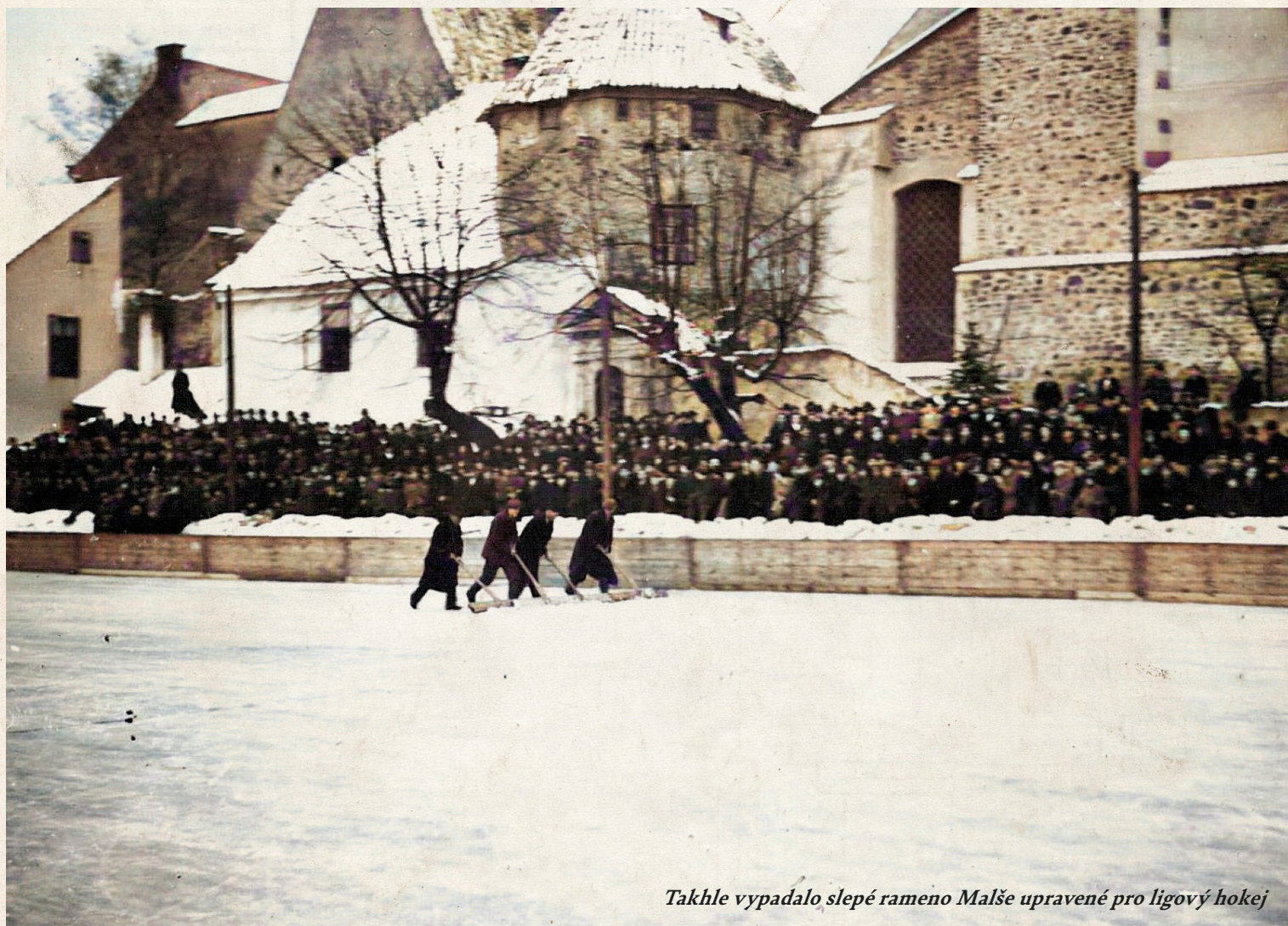
Takhle vypadalo slepé rameno Malše upravené pro ligový hokej

3. ledna 1937 bylo velké datum našeho hokeje. Vůbec první zápas premiérové ligové soutěže se měl hrát už ve 14:30 na slepém rameni Malše v Českých Budějovicích, kam přijela Mladá Boleslav. Jenže přišla menší obleva, a tak se utkání muselo odložit na večer téhož dne. Mezitím se tak uskutečnily zápasy Vítkovice Sparta (1:1) a Tatry – Slavia (2:1). Premiérový gól historie naší ligy dal vítkovický Vilém Kubečka v 7. minutě duelu proti Spartě, který se hrál v Ostravě od 15 hodin.